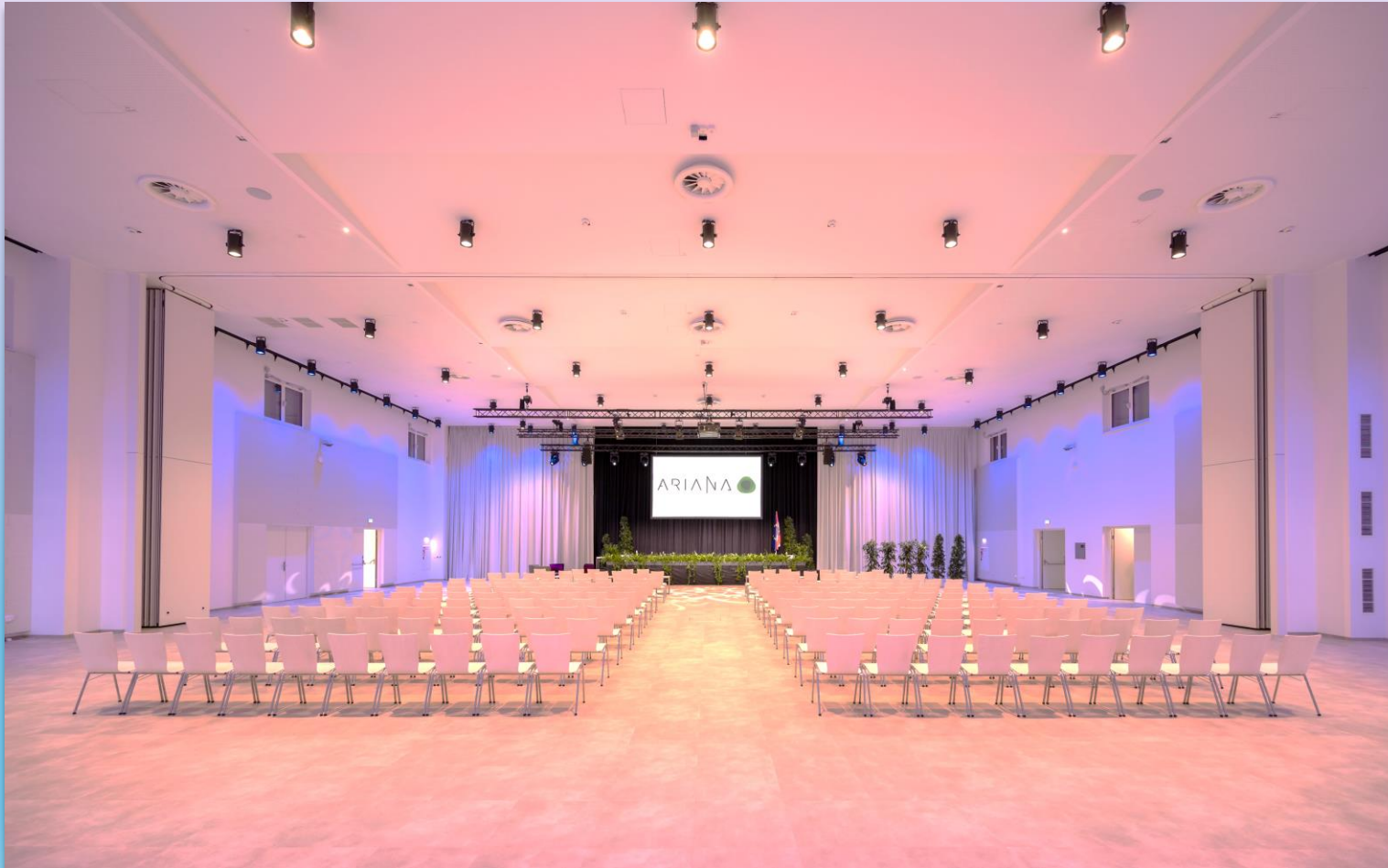
Saalplan zum Download

Ein teilbarer Saal mit 7m Raumhöhe, dessen modulares Raumkonzept eine Vielzahl an Möglichkeiten bietet.